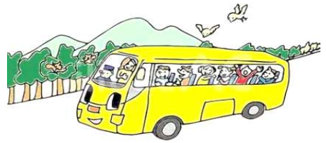
へいせんじ はくさんじんじゃ

今年は勝山市の『平泉寺白山神社』を訪問します。歴史ある社殿をゆっくり探訪。 午後からは越前の小京都大野市を散策。猫寺として知られる御誕生寺にも足を延ばして みようと思います。皆様のご参加をお待ちしています。