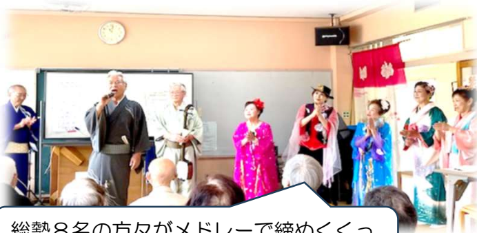
総勢8名の方々がメドレーで締めくくって下さいました