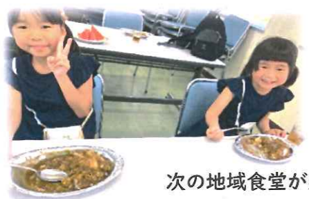
次の地域食堂が楽しみ♪ と嬉しい言葉を頂きました。