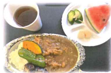
玉ねぎたっぷり 夏野菜カレー

8/3(土)に地域食堂を開催しました。食事に来てくれたのは子ども大人合わせて19名でした。メニューは玉ねぎをたっぷり使った夏野菜カレーで、皆さん「とても美味しい♪」と笑顔で食べてくれました。次回開催が決まり次第、広報にてご案内します。引き続き「心地よい居場所づくり」を目指していきたいと思っておりますので、今後も参加や応援をよろしくお願いします。