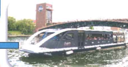
富岩水上ライン « fugan »に 乗船しました