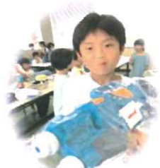
お目当ての水鉄砲をゲット にニコリ♪