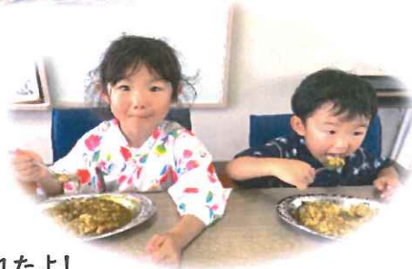
大好きなカレー たくさん食べれたよ!