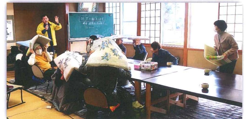
揺れが収まるまで座布団で頭を守って～