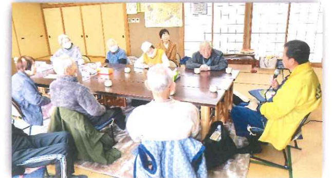
地震が起きたら・・・防災士から話を聞きました。