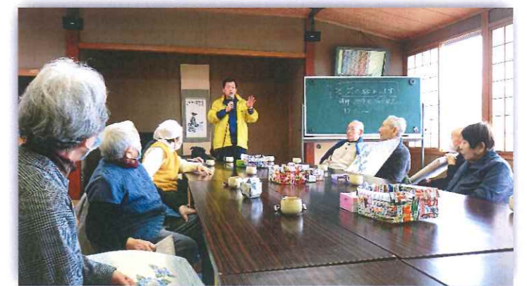
避難訓練お疲れさまでした!