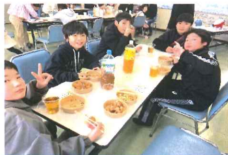
おやつはたこ焼き♪