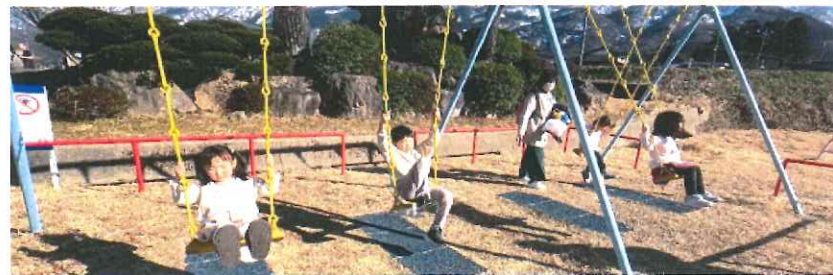
ポカポカ日和♪ ブランコは大人気!