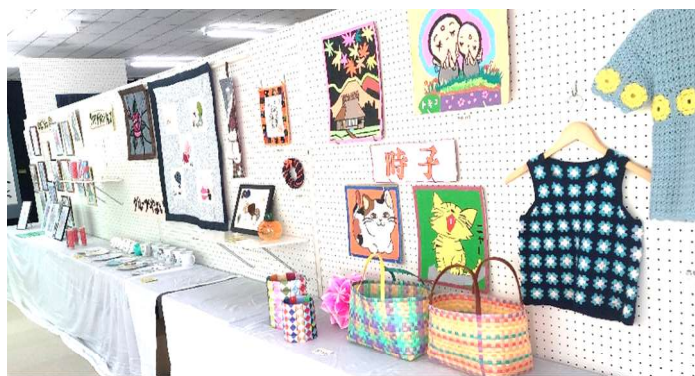
↓喫茶も大盛況でした♪